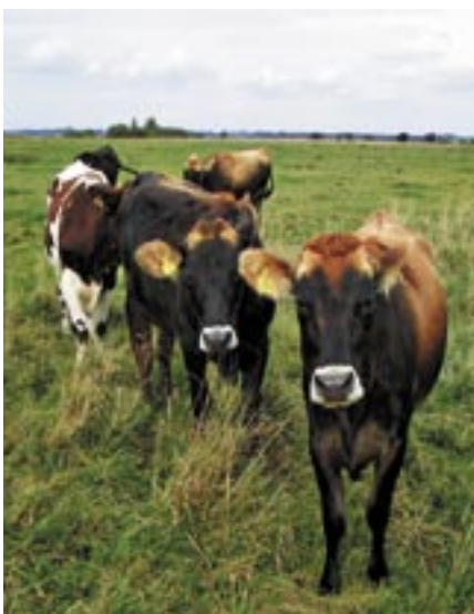
Kvier er de mest almindelige dyr i kogræsserforeninger. Nogle mener, at de giver det bedste og møreste kød.

Er de af malke race, kan der være behov for supplerende fodring sidst på sæsonen. Det er meget rolige dyr, som er nemme at håndtere. Det er store dyr, som giver meget kød!