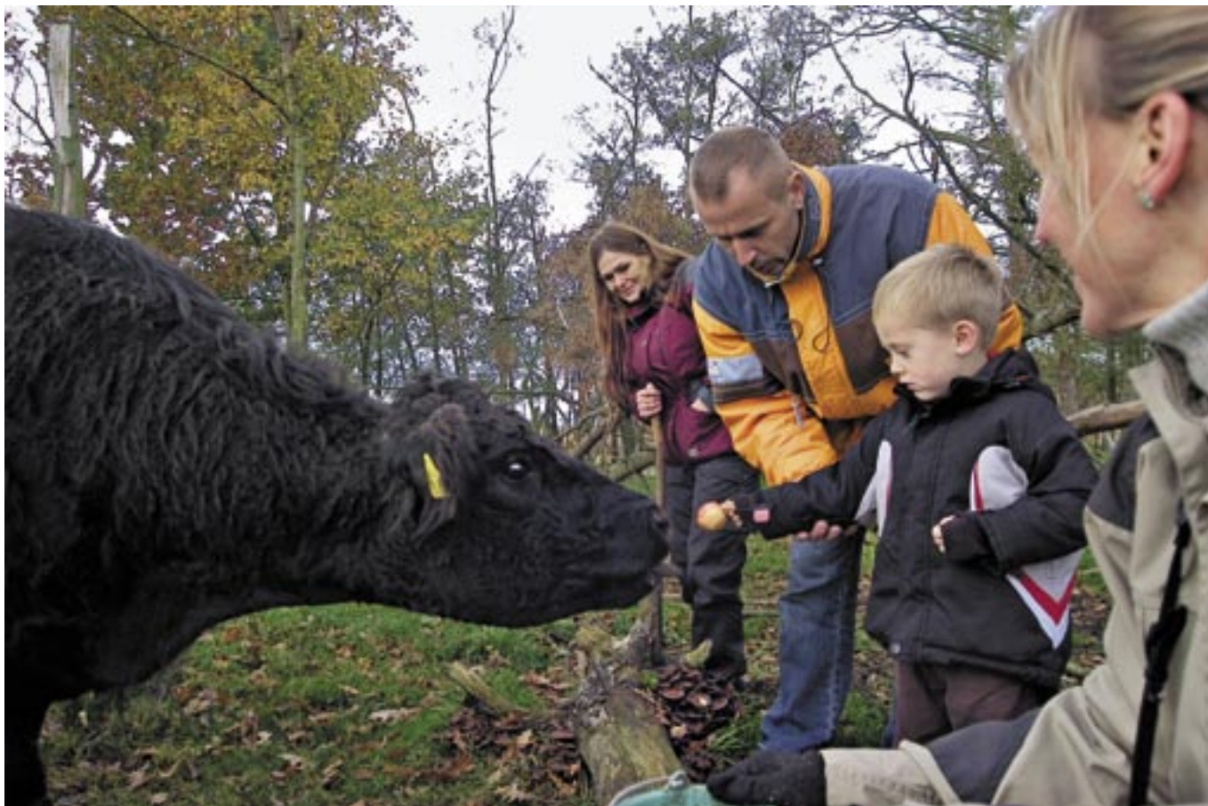
Hele familien kan deltage i pasningen af foreningens dyr.

Pasningen af dyrene er den største opgave, man har som kogræssermedlem både i tid og vigtighed. Samtidig er det en opgave, som giver medlemmer af kogræsserforeninger store oplevelser og mening. Det er også det arbejde, der gør en forskel. Netop byrden med tilsyn betyder nemlig, at små naturarealer er for dyre i drift til, at de er interessante for landmændene.