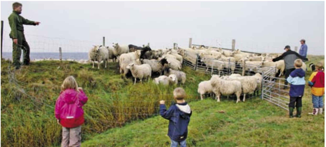
Får har en størrelse, som gør, at børnene kan være med til at håndtere dyrene.