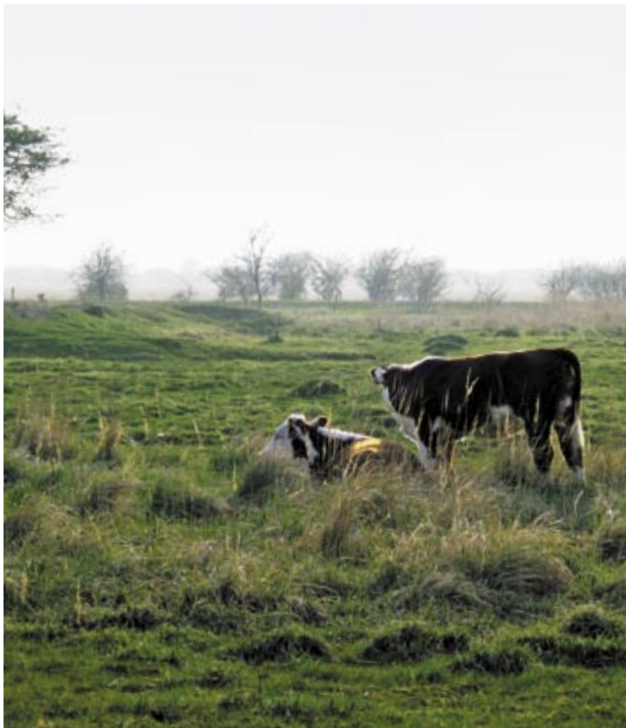
Hereford er en af de racer, der kan anvendes til helårsgræsning.