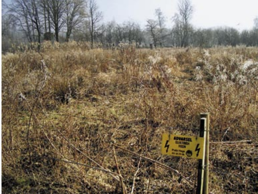
Når man hegner kvæg, bruger man ofte hegn af poda-type. Arealet her plejes af DN's lokalkomité i Farumx

Til et hegn hører en spændingsgiver, som sender strømimpulser gennem hegnet. Strøm er absolut nødvendigt, for at holde dyrene inde. Spændingsgivere findes i forskellige styrker, alt