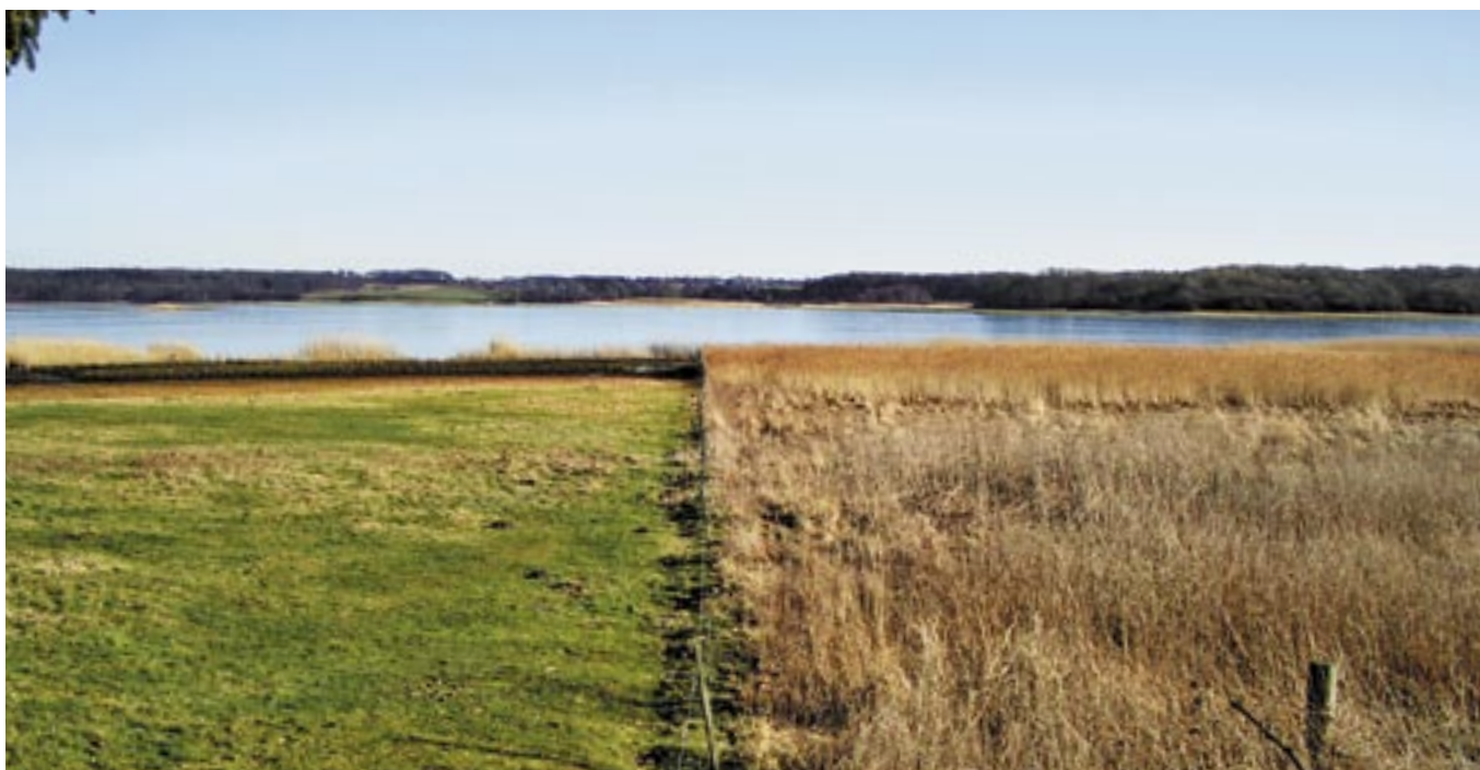
Strandeng med og uden græsning