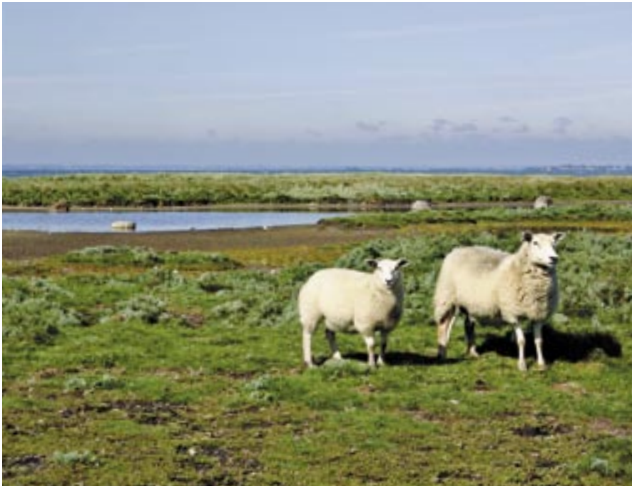
Valg af fårace er ikke så afgørende for naturplejen. Derimod betyder racen meget for smagen af kødet. Her er det en blanding af Texel og Gotlænder.