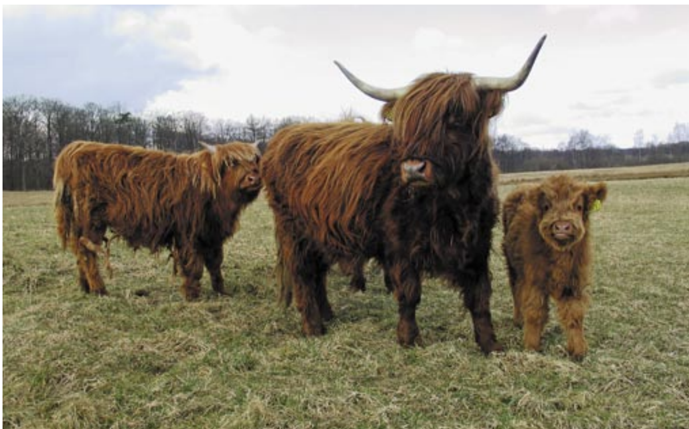
Skotsk Højland er fremragende naturplejere og flotte at se på.

Køer, hvor kalvene bliver ved moderen, kaldes for ammekøer. De er gode naturplejere og er normalt rolige dyr. Man skal dog være opmærksom på,