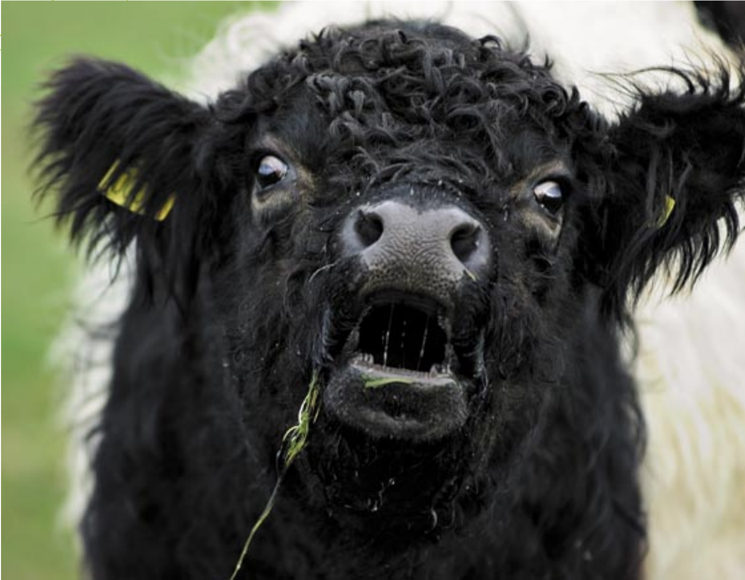
Galloway er en af de bedste racer til naturpleje - der findes både ensfarvede og bæltede Galloway.

Græsningsdyrene er det egentlige omdrejningspunkt i foreningen. I princippet kan alle former for græsædere vælges, men meget ofte sætter arealet eller omgivelserne begrænsninger for, hvad man kan vælge imellem.