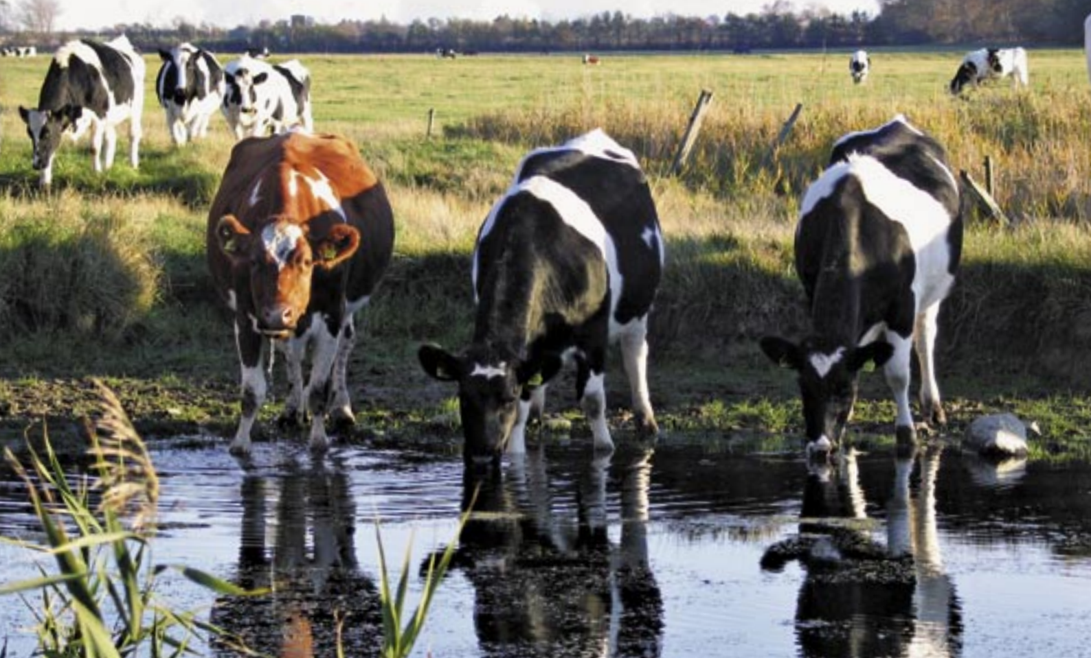
Større vandhuller kan sagtens fungere som vanding for køerne.