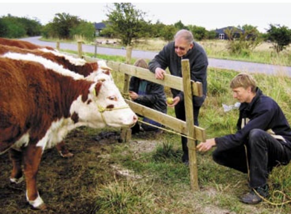
Hvis man har håndtamme dyr kan man bruge et fanghegn i stedet for en egentlig fangefold, når man skal indfange sine dyr.

En god fold er indrettet, så der er kørefast vej helt til leddet. I folden må der gerne være skygge til dyrene, og den må gerne være indrettet, så de har mulighed for at kunne gå lidt i fred. Råder man over et større areal,