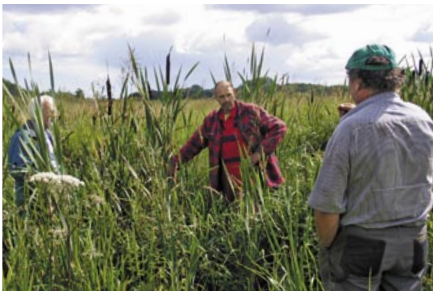
“Hvor skal hjørnestolpen stå?”

Selv om hegn af god kvalitet kan holde i mange år, skal man være omhyggelig med at efterse og vedligeholde hegnet. Før sæsonen skal hegnet gås grundigt efter. Tjek, om alle hjørnepæle står fast. Slap tråd skal strammes op, og ødelagte isolatorer skal udskiftes. Er der en rusten tråd, skal den udskiftes.