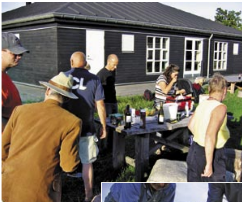
Sundby Kogræsser Forening er ikke kun slid og slæb - men også store bøffer og god rødvin.

Det vil være naturligt at kæde foreningens faste opgaver sammen med sådanne arrangementer. Dette kan være udbindingsfest, når dyrene sættes på græs eller gravøl og fællesspisning, når dyrene er slagtet. Nogle foreninger har en fast tradition med et sommerbesøg hos den landmand, der har leveret dyrene til foreningen.