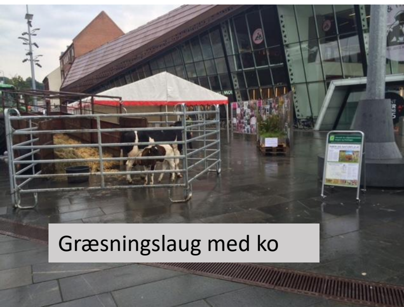
Græsningslag med ko