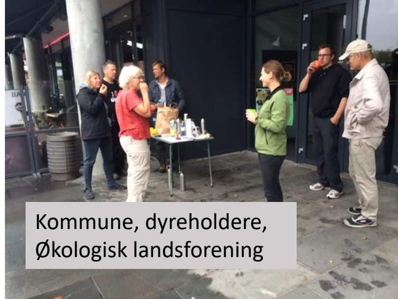
Kommune, dyreholdere, Økologisk landsforening