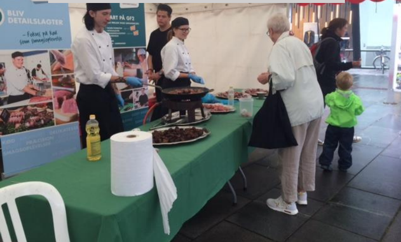
Kokkeskolen med naturkød