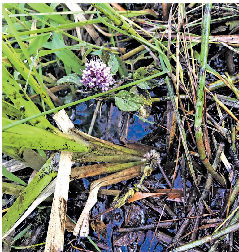
Området er meget vådt, men gemmer på en frøpulje af urter, som på grund af plejen får plads og lys til at spire. Her ses vandmynte.

I samarbejde med Esbjerg og Varde kommuner samt rådgivnings-