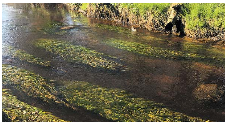
Vandranunkel danner fine puder, der giver skjulested for fiskene.

Læs mere på www.ogro.dk eller kontakt os på tlf. 5156 4729