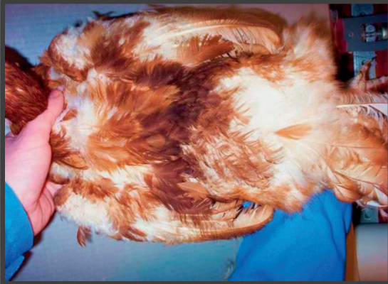
Let pillet brun høne