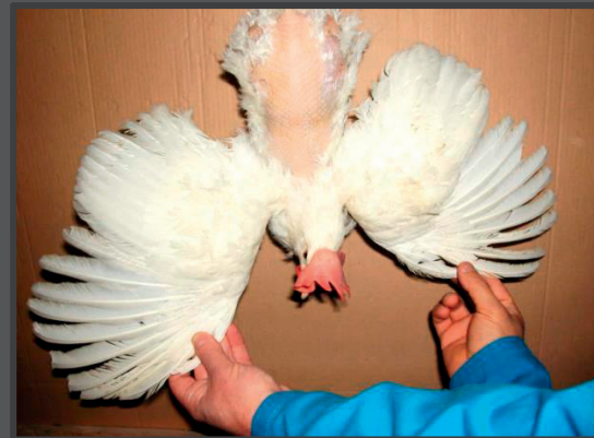
Hvid høne pillet på ryg