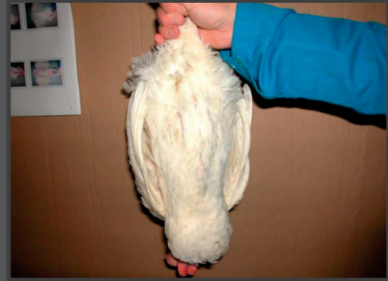
Hvid høne med spor af begyndende fjerpilning