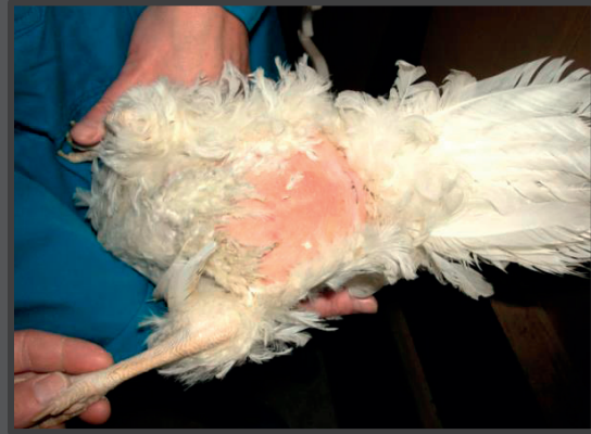
Hvid høne pillet ved gumpen