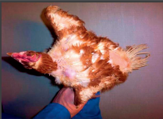
Mellempillet brun høne