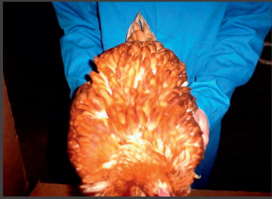
Fuldfjeret brun høne