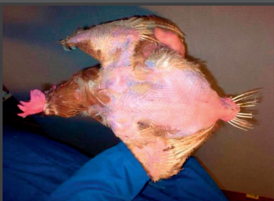
Svært pillet brun høne