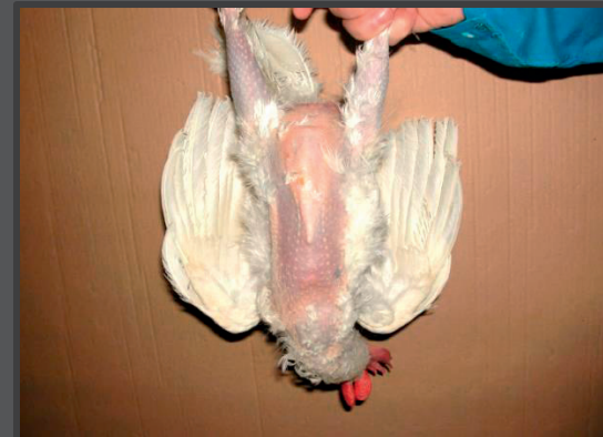
Hvid høne svært pillet på mave og lår