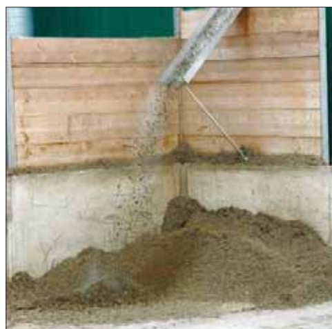
Projekterne får i alt fire mio. kr. fra Fødevareministeriets erhvervsudviklingsordning til at afprøve nye teknologiske løsninger, der kan håndtere plantemateriale i biogasanlæggen.