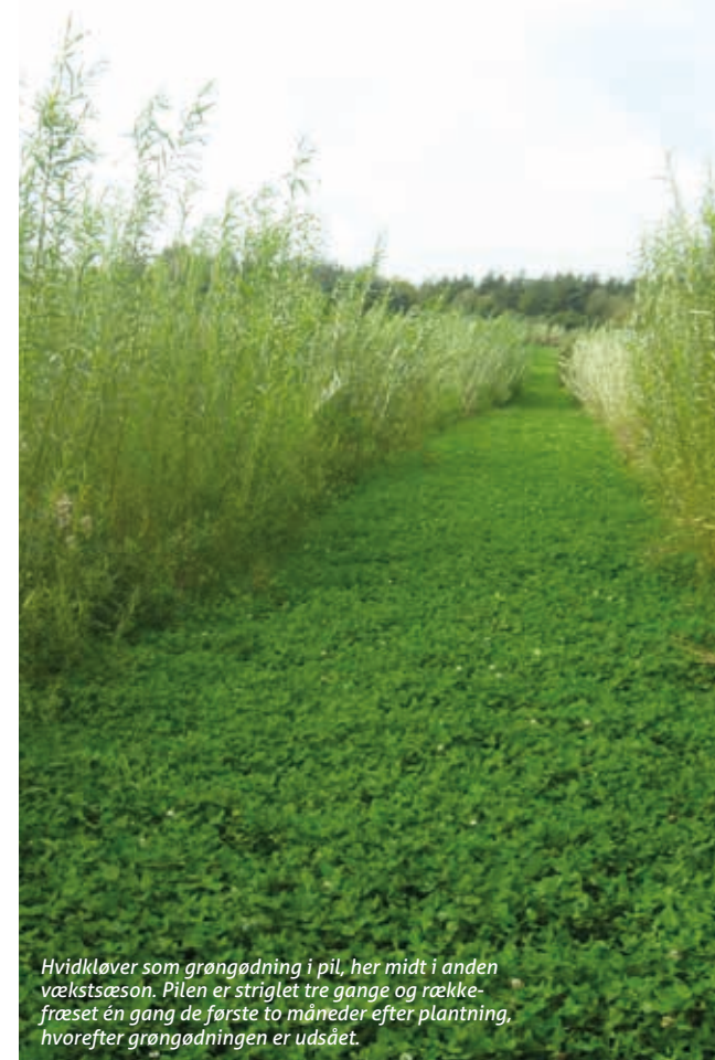
Hvidkløver som grøngødning i pil, her midt i anden vækstsæson. Pilen er striglet tre gange og rækkefræsset én gang de første to måneder efter plantning, hvorefter grøngødningen er udsået.