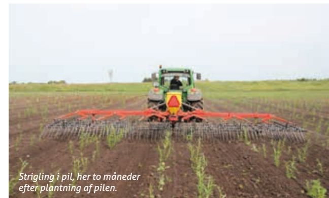
Strigling i pil, her to måneder efter plantning af pilen.

Hvis der kan opnås tilstrækkeligt tørt flis, kan flisen også bruges i mindre flisfyrede kedler, f.eks. til varmforsyning på landbrugsbedrifter eller lignende.