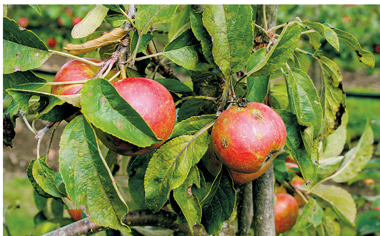
Skurv i økologiske æbler kan nu forebygges med natron.