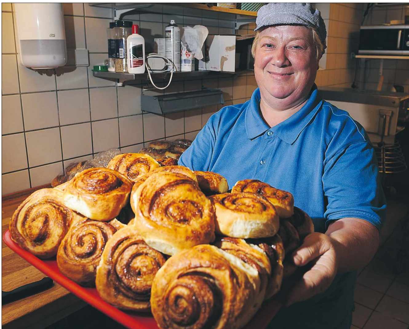
Kanelsneglene på Halvorsminde er et helt kapitel for sig. Opskriften er selvfølgelig med i den nye kogebog "Halvors spisekammer".