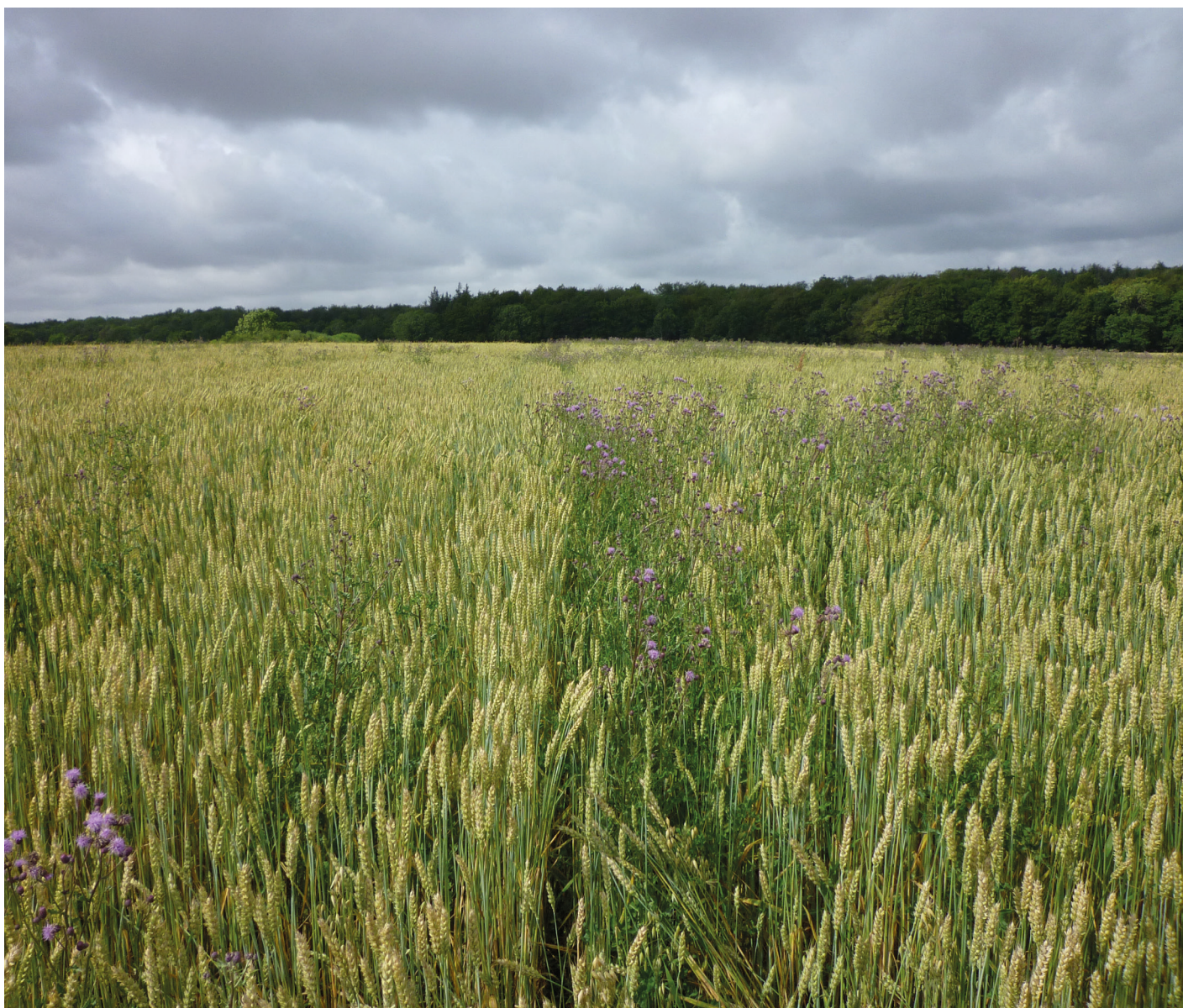
Effekten af to pløjninger er tydelig i denne hvedemark, hvor venstre del er pløjet ved høst og igen om foråret.